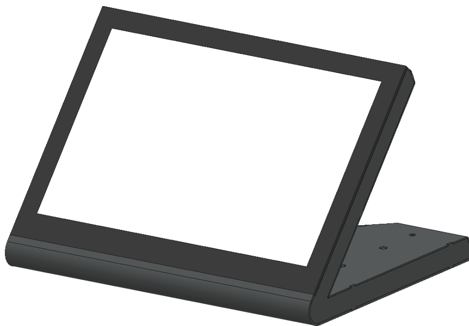
Рисунок 1 — Внешний вид изделия. Вид спереди

Внешний вид изделия представлен на рисунках 1, 2.